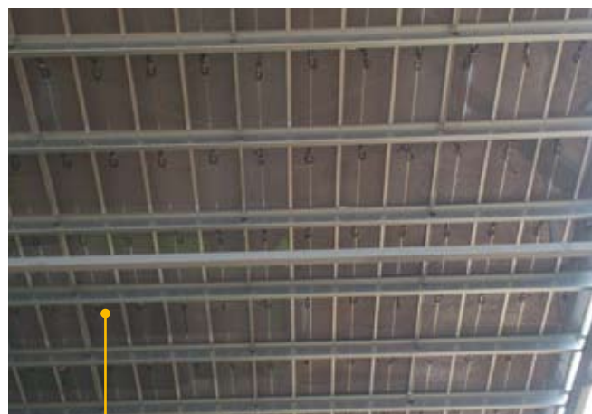
Branchement électrique accessible en sous face