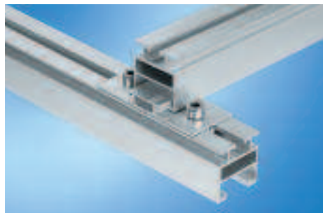
Raccords en croix, pour la meilleure pose possible des installations de grandes dimensions