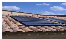
Modèle FOG 13