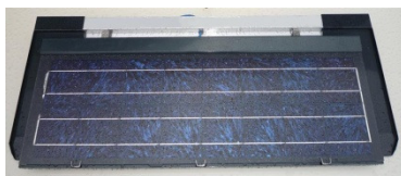
Modèle FOG 10

4 types de châssis pour couvrir la gamme des tuiles terre cuite